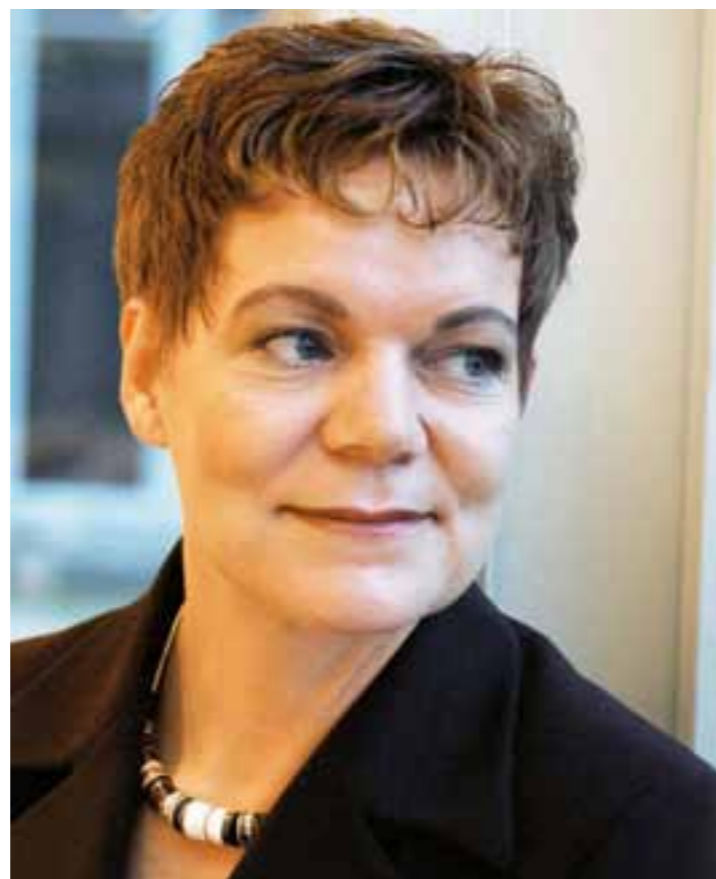
Kleider: Ingrid Baumann, Occas Secondhand Boutique, Bern